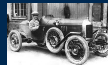
Première MG de compétition, Old Number One est conçue et pilotée par Cecil Kimber. En 1925, elle remporte une médaille d'or au Trial du Land's End.

RETROUVEZ LA SUITE DE CET ARTICLE DANS L'AUTHENTIQUE N° 20