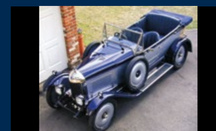
Cecil Kimber propose la MG 14/28 sur une base de Morris Oxford. Véritable succès, plus de 400 exemplaires sont vendus.