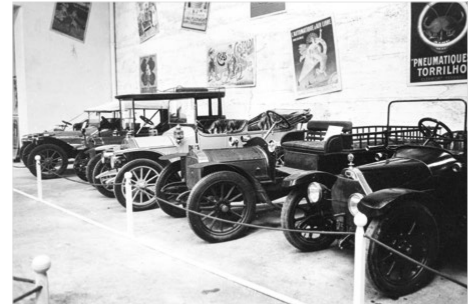
Avenue Berthelot, au cours des Années cinquante, les voitures anciennes ont leur espace réservé. Mais, au goût de certains employés de « La Boîte », elles occupent alors trop de place !