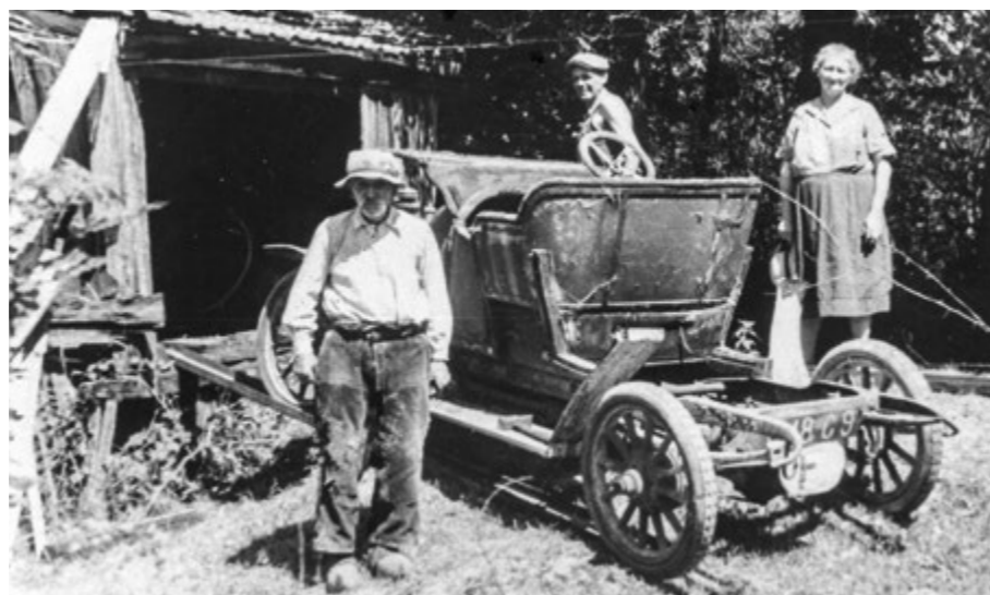
Cette Peugeot de 1908 était stationnée depuis de longues années dans une cabane au toit percé et entourée d'un fossé pour éviter les vols. L'en sortir n'a pas été une mince affaire !

détachées encore utilisables. Le métier de récupérateur existe déjà, mais son idée est de le rationaliser. Pour cela, il faut classer, répertorier chaque pièce,