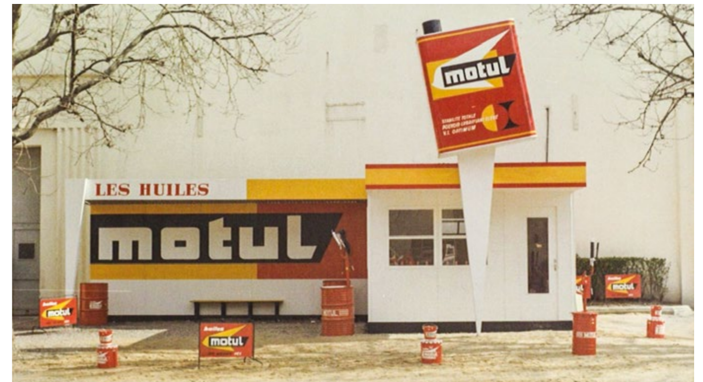
Au début des Années soixante, la marque est présente au Salon l'Automobile à Paris avec, ici, un stand en extérieur au parc des Expositions de la Porte de Versailles. On y retrouve le logo et les couleurs de Motul de l'époque, mais aussi les différents conditionnements de sa gamme de lubrifiants d'alors.

de ses huiles entièrement synthétiques. Spécialiste reconnu pour son savoir-faire dans le secteur des lubrifiants, Motul est depuis les Années cinquante le partenaire incontournable de nombreux constructeurs et écuries sportives dans l'automobile, la motocyclette, le motonautisme et encore bien d'autres disciplines. Au total, plusieurs dizaines de titres mondiaux et de nombreuses victoires lors de courses mythiques telles que les 24 Heures du Mans ou le MotoGP sont déjà venus couronner cette passion et cet engagement. Pionnier aussi par son